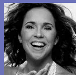
DANIELA MERCURY E CONVIDADOS