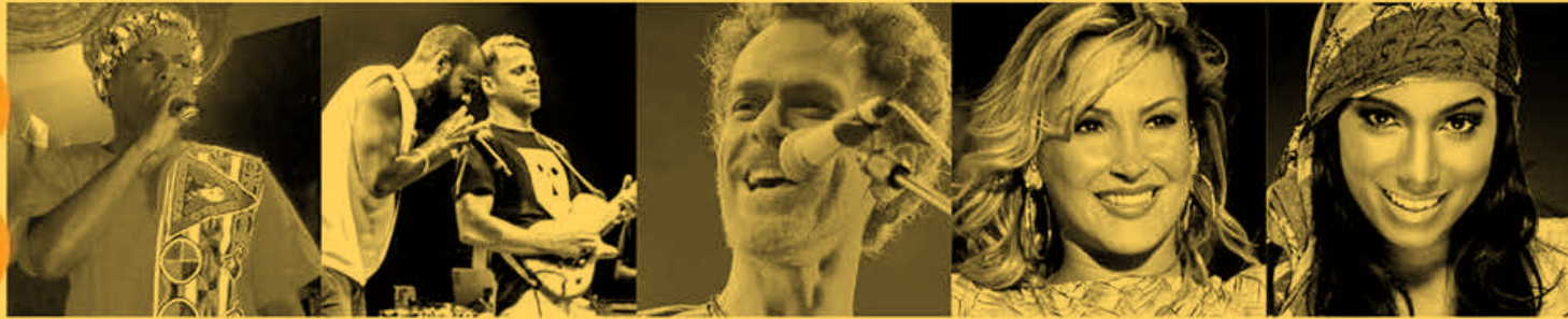
MUZENZA BAIANASystem NANDO REIS CLAUDIA LEITTE ANITTA