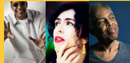
JORGE BEN JOR, MARISA MONTE E GILBERTO GIL