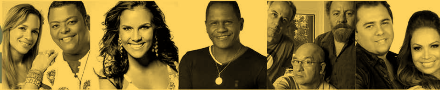
FILHOS DE JORGE JU MORAES ARAKETU PARALAMAS AVIÕES